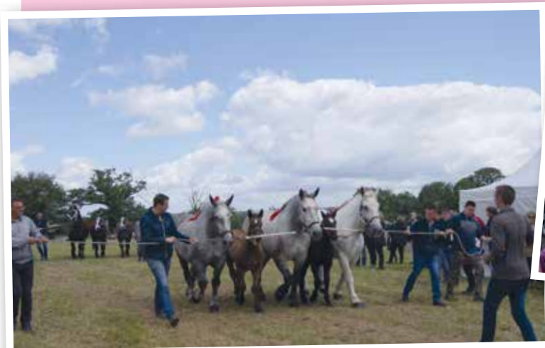
Samedi 8 juin : comice agricole