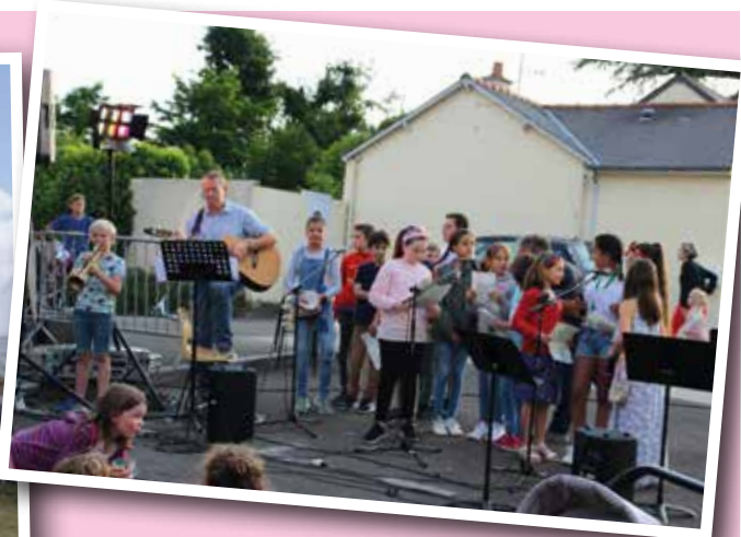
Vendredi 14 juin : fête de la musique