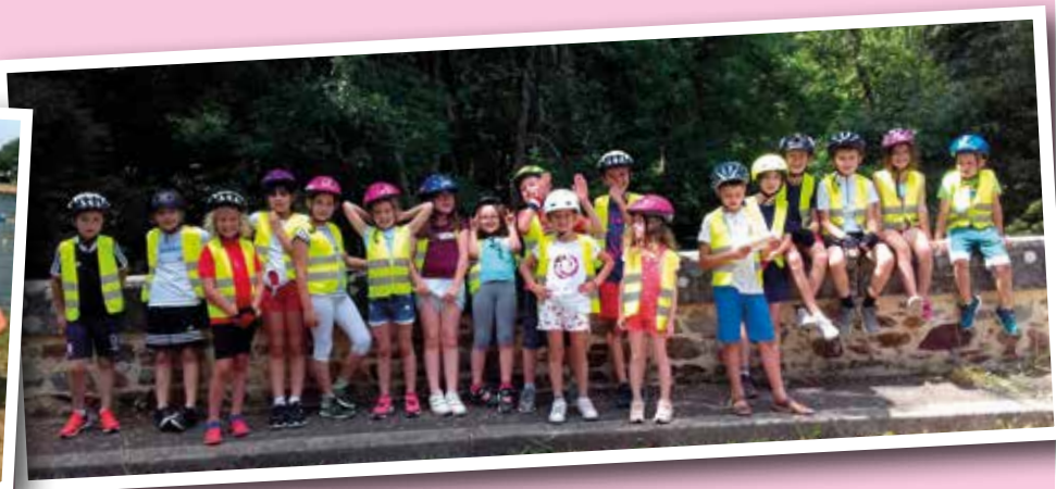
Centre de loisirs cet été, avec la sortie à l'Aquapark de Pouancé et en sortie vélo