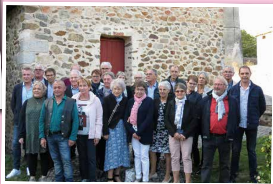
Samedi 28 septembre : les Classes 8 et 9