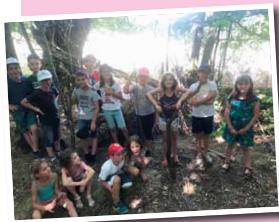
Centre de loisirs cabane dans le bois de Montigné